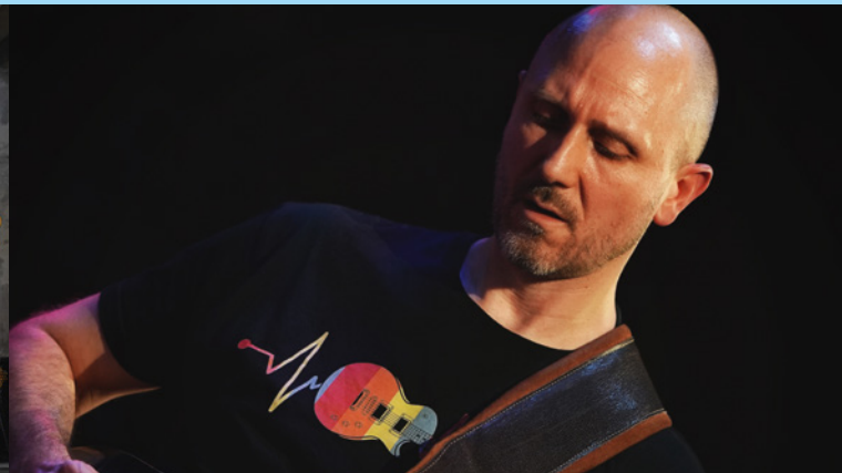
VLADO GRIZELJ - PURPLE RAIN

Mit raffinierten Effekten, perkussivem Klavierspiel und dem Wechsel zwischen Cello und E-Bass entsteht ein intensives, emotionales und überraschendes Klangerlebnis.