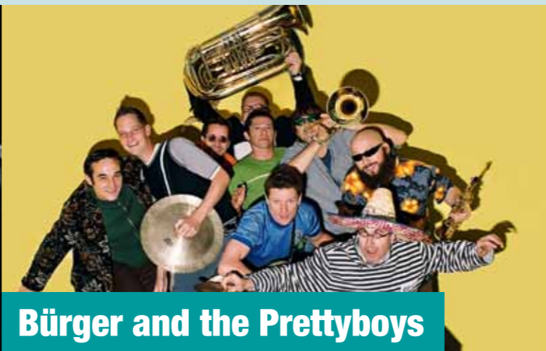
Bürger and the Prettyboys

Dienstag, 6.8.2013, 82335 Berg Mühlgasse 7, Villa Marstall Beginn: 20 Uhr, Eintritt: 25 Euro