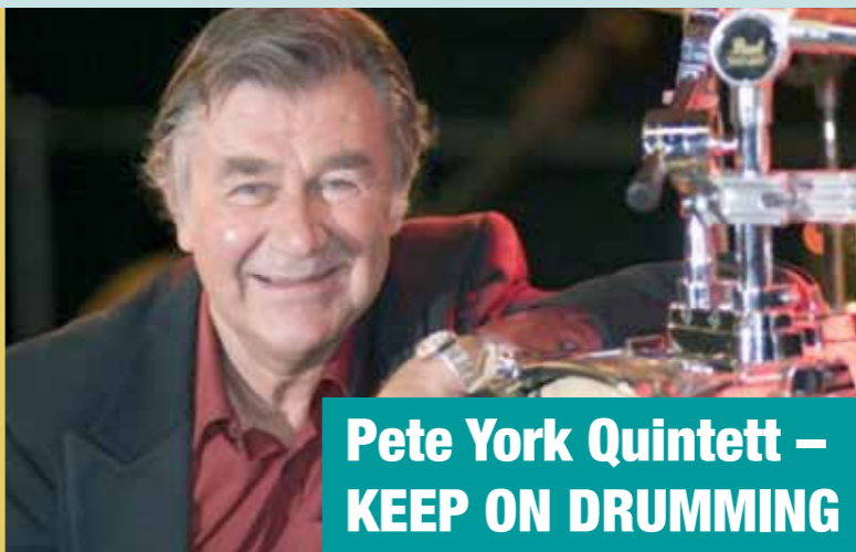
Pete York Quintett – KEEP ON DRUMMING

Mittwoch, 7.8.2013, 82327 Tutzing Museums-Schiff, Steg im Kustermannpark Beginn: 20 Uhr, Eintritt: 20 Euro