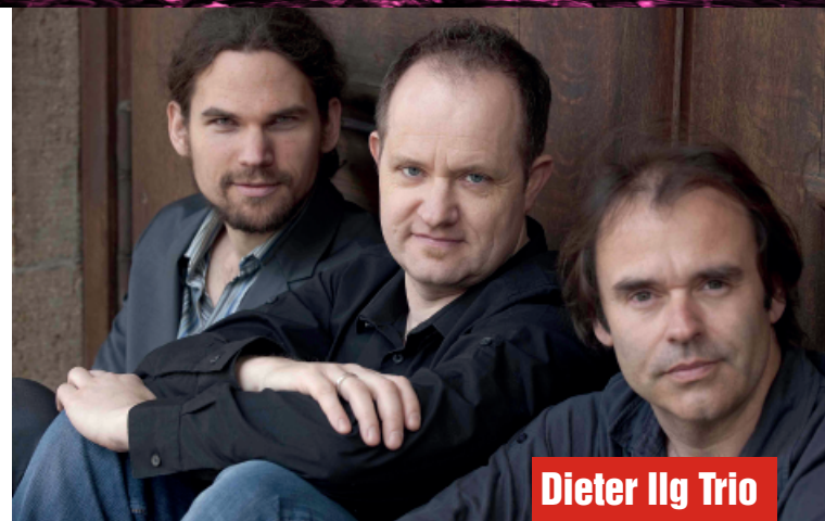
Dieter Ilg Trio

Das 5. Starnberger SeeJazz Festival findet vom 12. bis 20. August 2017, und damit erneut in der Ferienzeit statt. Die begeisterte Resonanz der Festivalbesucher der vergangenen Jahre bestärkt uns in unserem Anliegen, das Festival als feste Einrichtung des kulturellen Lebens unserer Region zu etablieren.